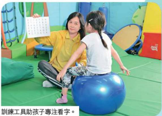
訓練工具助孩子專注看字。

而經初步甄別測試後，亦可提早介入作訓練，爭取在學前接受一些改進的方法。徐詩茹更引述研究指出，由於學前兒童做半小時訓練，其效果相等於小四學生做兩小時的訓練，故及早介入有其好處。這些訓練是一些有系統性的學習方法，例如多感官學習，以助幼兒嘗試跟上學習進度，待幼兒升上小一後才進行正式的評估。