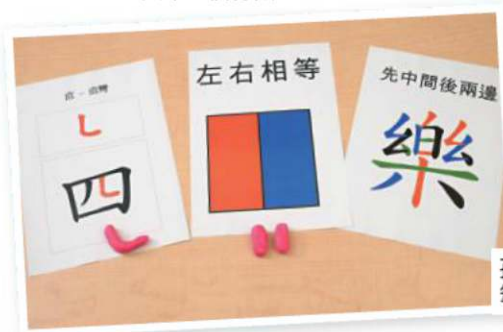
孩子可以顏色分辨筆順及部件。