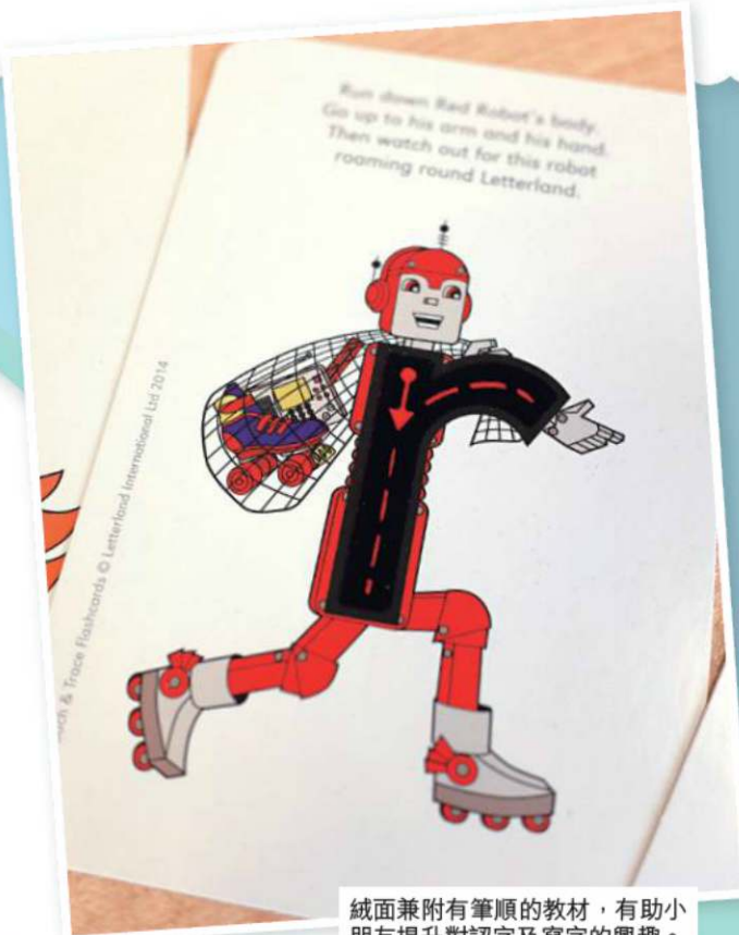
絨面兼附有筆順的教材，有助小朋友提升對認字及寫字的興趣。