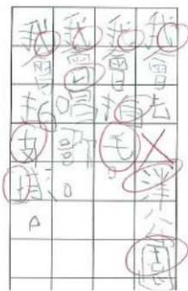
有讀寫困難的孩子會經常把字寫成鏡面字或寫出界。

我對此印像很深刻，因為當時實在太frustrated（有挫敗感）。」妹妹亦有認字問題，例如「故」字會讀成「古」音、「峽」字會讀成「夾」音。「經過訓練後其實妹妹的情況的確有好轉，而她在慈善機構博思會接受的訓練會教她形聲字、象形字等。其實那『峽』字她起碼沒有讀成『山』字音，我已經偷笑了。」