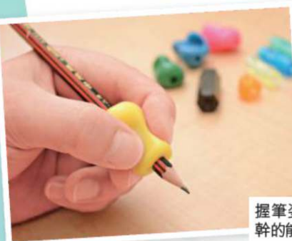
握筆姿勢不正確會影響控制筆幹的能力，此時可考慮執筆膠。

不過，她同時也提醒家長，每名小朋友對執筆膠的接受程度不一，「有些小朋友會覺得不舒服，所以要先讓他們試用，否則買了不會用，會很浪費。」