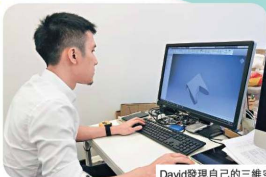
David發現自己的三維空間感較強。